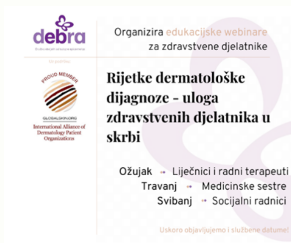
Obavijest o edukacijama

Nakon svakog predavanja ispunjavali su se evaluacijski obrasci koji su pokazali neophodnost provođenja ovakve vrste edukacije o rijetkim bolestima. U narednim aktivnostima nastojati ćemo edukacije s naglaskom na integriranu zdravstvenu skrb provoditi i nadalje.