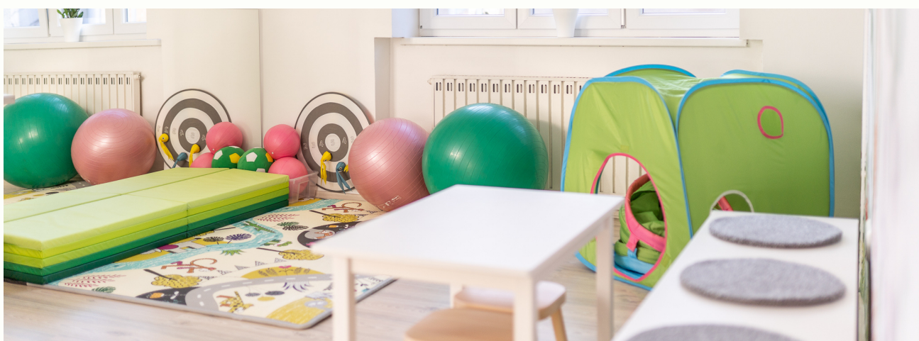
Soba za provođenje radne terapije