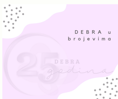
Kampanja za društvene mreže

U rujnu 2021. godine Udruga je proslavila 25 godina svog rada. Kroz kampanju na društvenim mrežama „DEBRA u brojkama“ istaknuli smo važne događaje u proteklih 25 godina, a naši članovi i prijatelji udruge snimili su videozapise s čestitkama. Animirani promotivni film lijepo je završio rođendansku priču te smo njime ušli u listopad, mjesec u kojem se obilježava Međunarodni dan bulozne epidermolize te tjedan svjesnosti o buloznoj epidermolizi. DEBRA je i u 2021. godini kampanjom prigodno obilježila mjesec svjesnosti kroz razne aktivnosti kao što su gostovanje u medijima, edukacijama te putem društvenih meža. Na sam Međunarodni dan bulozne epidermolize 25. listopada zagrebačke fontane zasvijetlile su u bojama udruge. Cilj ovogodišnje kampanje bio je educiranje i informiranje javnosti o samoj bolesti, ali i kako se ponašati prema oboljelima, a brojne osobe poznate javnosti djelile su promotivni animirani film na svojim društvenim mrežama.