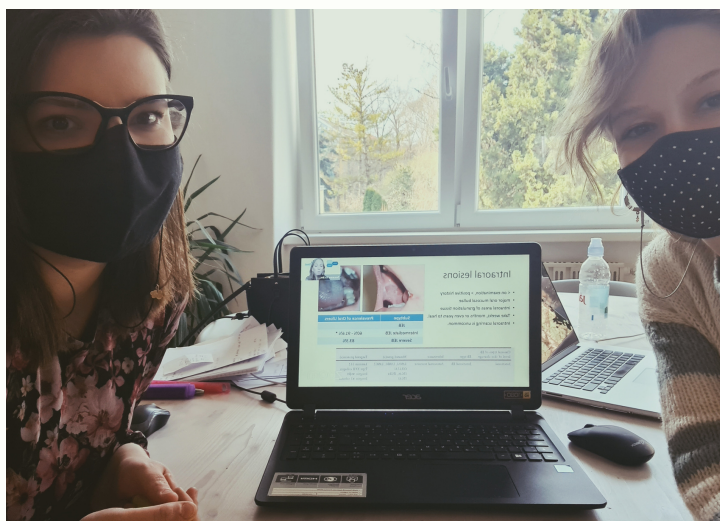
DEBRA International seminar Oral health & EB