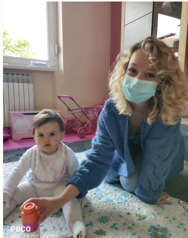
Pružanje podrške u domu obitelji