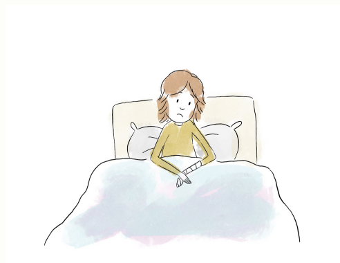
Scene iz promotivnog animiranog filma