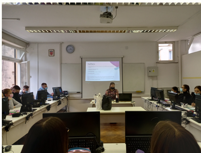
Edukacija učenika završnih razreda srednjeg medicinskog obrazovanja

Nastavljena je suradnja s Klinikom za dječje bolesti Zagreb, KBC-om Zagreb, Školom za medicinske sestre Vrapče, Školom za medicinske sestre Vinogradska.